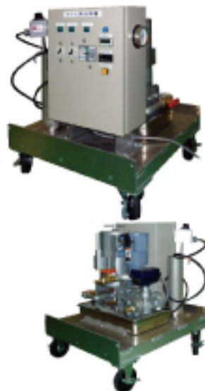
可搬型オイル濾過再生装置

http://www.sp-eng.co.jp/products/oil-saisei.html